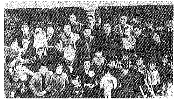
ロンドン別館にての家族会