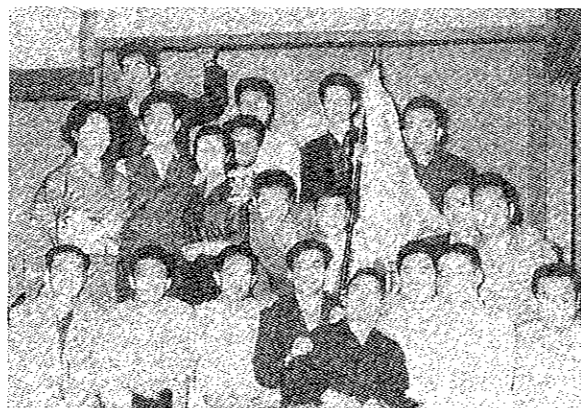
みなと祭り仮装行列「レジャー時代・JCハワイへ行く」で出演。レジャーブーム到来の時代で、時代を先取りしたアイデアで見事優勝。