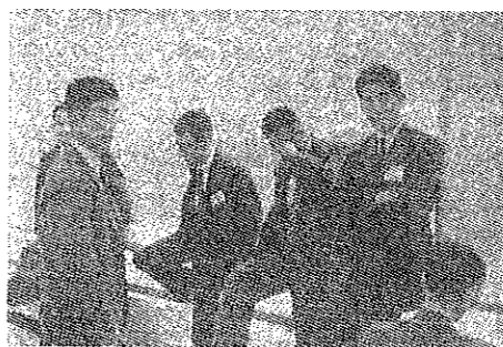
第12回四国地区会員大会 (松山にて)