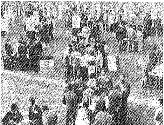
5月10日宇和島天教園で行われた四国地区大会