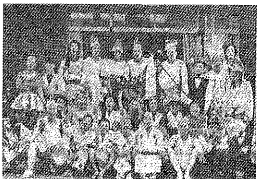
みなと祭り仮装行列「踊る竜宮城」