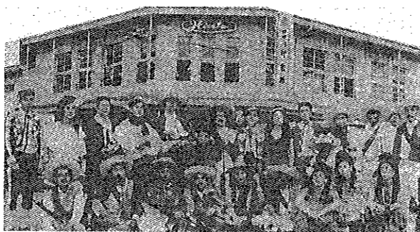
みなと祭り仮装行列参加「4年たったら又会いましょう」全員次のオリンピック開催地メキシコの扮装で出演