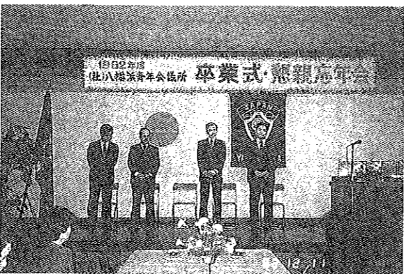
卒業式懇親会忘年会4名のメンバーが卒業