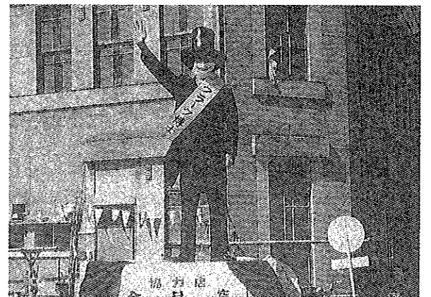
八幡浜みなと祭り“でっかいどう北海道” クラーク博士像 私はだれでしょう？

これらの重点事業の他、例会のあり方を考え1時間例会の励行、例会後の委員会アワー堀田建設社長をむかえて6JC経営開発交流会、大島におけるLD道場、530運動の5周年、3回にもおよぶ家族会など、一人一人が協力し大きな事業をやり終えたことで友情の輪が大きく広がった一年であった。