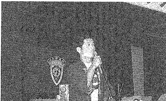
第12回ブロック会員大会懇親会主管理事長挨拶