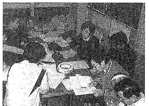
連日のアンケート集計作業