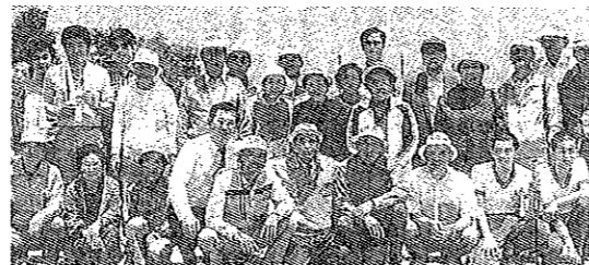
3世代交流ゲートボール大会