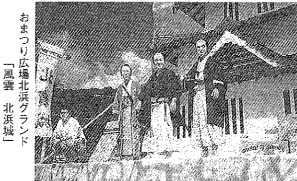
おまつり広場北浜グランド「風雲 北浜城」