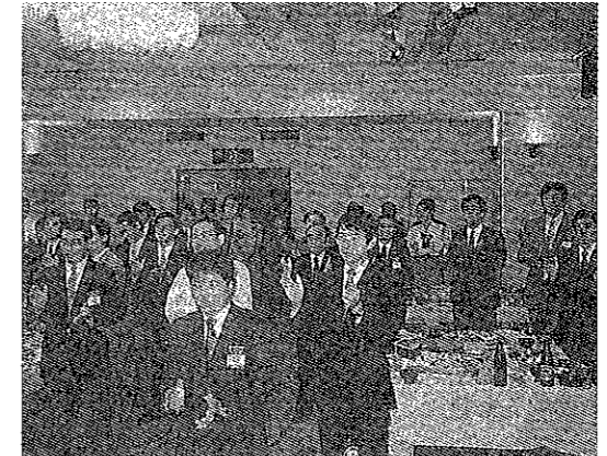
指導力・研修委員会合同研修会

8月9日、川之浜で行なわれた家族会には、100名を超える参加者があり、家族サービスに努めるメンバーの笑顔をあちこちで見ることが出来た。