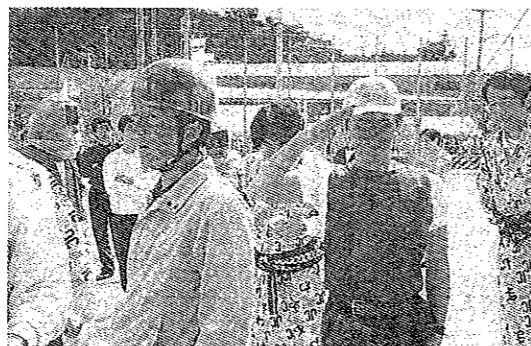
おまつり広場北浜グランド