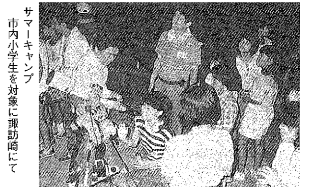
サマーキャンプ 市内小学生を対象に諏訪崎にて

9月、成川溪谷においての「白杵JCとの交流会・経営セミナー」には、宇和島JCのメンバーにも友情参加して頂き、例年とは違った雰囲気で開催された。