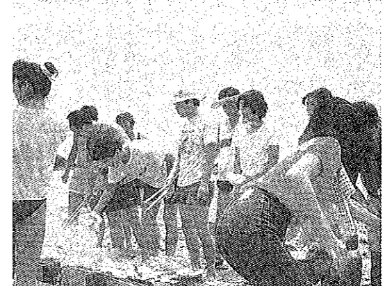
家族会川之浜海水浴場にてパーベキュー

12月12日、1987年度、年末定時総会。社団法人八幡浜青年会議所は、3名の卒業生を見送った。