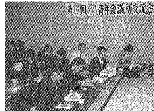
白杵JCとの交流会経営セミナー

まちづくり委員会においては、「八幡浜の魅力度アンケート調査」の実施を通して私たちの故郷の魅力を客観的に捕らえるため、市人会・同窓会名簿などから市外・県外で活躍されている方々に外から見た「八幡浜」についての御意見を寄せて頂いた。中には、丁寧な書簡を添えて頂くなど予想以上の反響があり、「八幡浜」の魅力の掘り起こし、再認識に大いに役立つものとなった。また、9月には近隣のLOMの情報交換・親睦の場となった「港町フォーラム87」を「海で結ぶ未来のまちづくり」のスローガンのもとで、宇和島・南宇和・白杵・別府・佐賀関・八幡浜の6つの港町のLOMが集まり町の現状、これからの展望などについて意見を交換した。