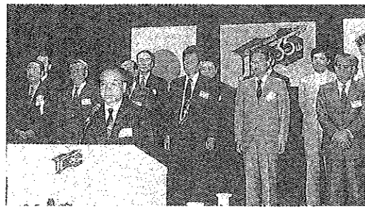
創立35周年記念式典市民会館中ホール

6月15日あいにくの小雨模様であったが、OB、来賓、スポンサーJC（山本泰人東京JC理事長）など数多くのお客様をお迎えし、創立35周年記念式典が挙行された。