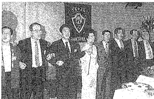
創立35周年大懇親会 センチュリーホテルにて

式典終了後、三瓶、三崎、瀬戸、保内の4町長と八幡浜市長による「21世紀の展望」と題して八西サミットが開催され八西地域、発展の為一市五町が一致団結せねばならぬという点で意見が一致。予定時間がオーバーするほどの盛り上がりであった。その後盛大に懇親会がもよおされ我が八幡浜JCのパワーとOB諸兄の存在の大きさに感激した一日であった。