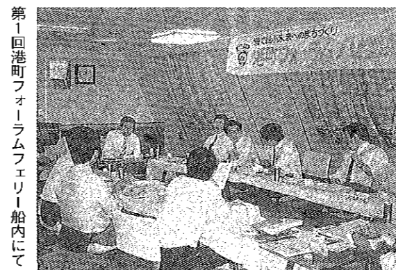
第1回港町フォーラムフェリー船内にて

LOM活性化会議では、年間を通して過去のLOM事業の見直しをし、その成果を八幡浜青年会議所内部充実の一助を担うため一冊の報告書にまとめた。この報告書は、先輩方の活動の一端を知り、それぞれの委員会活動の方向性を見出す事ができる画期的な資料となった。