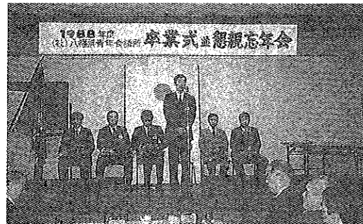
卒業式並懇親忘年会 商工会議所大ホール

この年大本理事長は「高度快適化社会の実現」を目指し青年経済人としての立場から地域社会の新たな発展に貢献していく「まちづくり」を推進していくため、「地域活性化委員会」を設置した。住みよい町づくりのため、それぞれに活動されている1市5町の青年層の方々との意見交換会を通じ、それぞれの町が抱える問題点・また共通の問題点・将来の展望等長時間に亘り熱心なやりとりがなされた。この交換会の後、各団体ごとに、かねてから計画されていたイベント・新たに企画された行事等が実施され、八幡浜青年会議所は、2月以降突然事業計画として持ち上がった「みなと夏まつり」の運営をし、LOMの委員会事業と同時進行で市民とまさに一体となったまちおこしに取り組んだ。