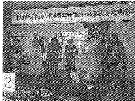
卒業式並懇親忘年会 ニューハーフ大会

3月25、26日には玖球町「21世紀をつくる会」との交流会がお互いのメンバー55名が参加し、懇談会、ビデオを見ながらの町の紹介や団体の目標、活動内容を話し合いながらごやかな内に親睦が計られ、又八西地区の諏訪崎、伊方ビクターズハウスなどの見学も行われた。