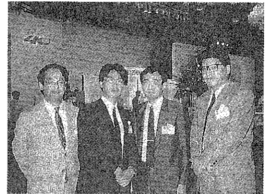
（社）東京JC40周年記念式典参加

しているこの地域の今後における方向を新しく考え、行動するために大きな試金石となるであろうと最後の挨拶をし又懇親忘年会ではJCメンバーがニューハーフ大会で場を盛り上げて公式スケジュールを無事終了した。