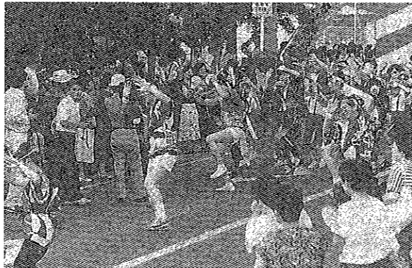
第1回てやてやフェスティバル踊り競演大会