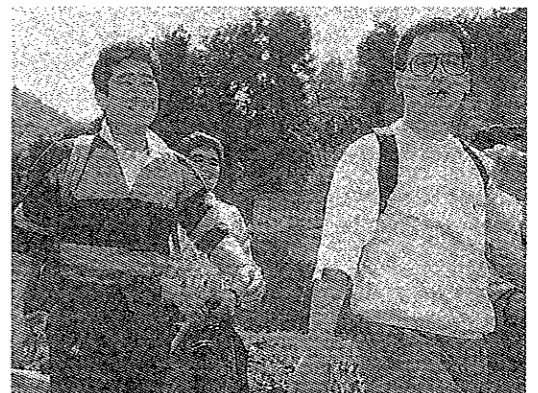
恐怖の出石寺徒歩行LD道場パーティ