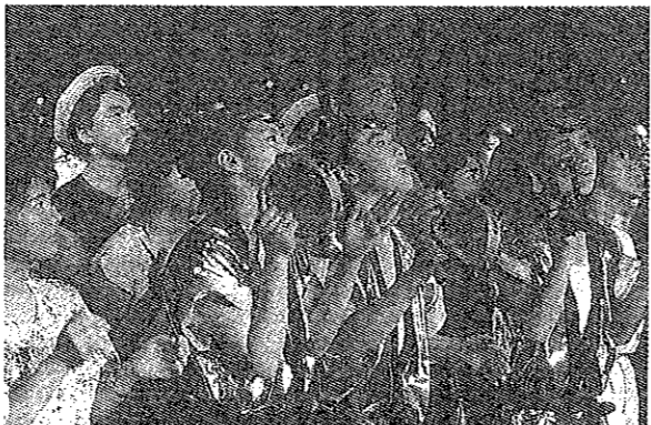
児童組コンサート出島特設会場にて