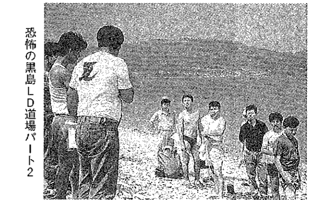
恐怖の黒島LD道場パーティ2