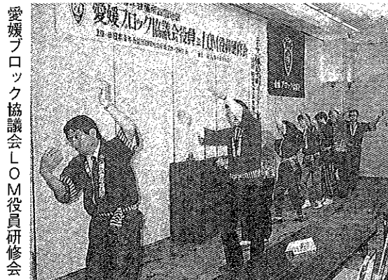
愛媛ブロック協議会LOM役員研修会

指導力開発委員会では、例会において「LDスーパータイム」と題して4回の委員会アワーを開催し、1/3を越える入会3年未満の会員の勉強のため、また在籍年数の長い会員の復習のためバズセッションやプレーストリーミングの勉強会を行なった。また、前年度メンバー対象に開催した日本創造教育研究所の交流分析セミナーを、愛媛ブロック役員並びにLOM役員研修会としてブロック内メンバー対象に開催した。