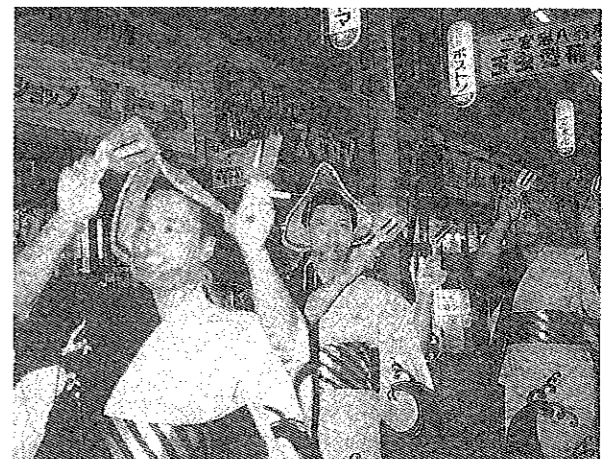
女装して参加したみなと祭り踊り競演大会