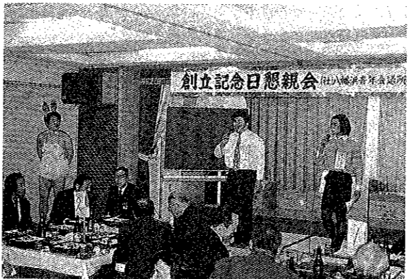
2月17日 創立記念日例会