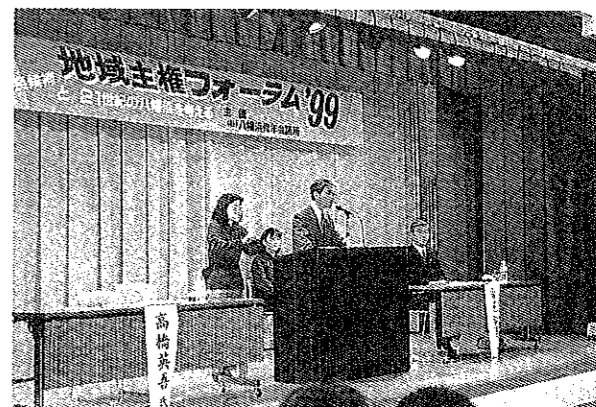
4月2日 地域主権フォーラム'99