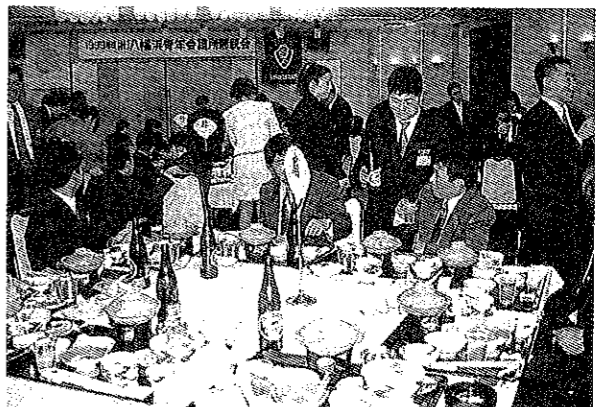
12月7日 年度末総会及び卒業式