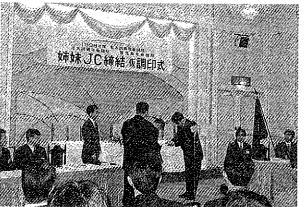
3月12日 合同公式訪問例会