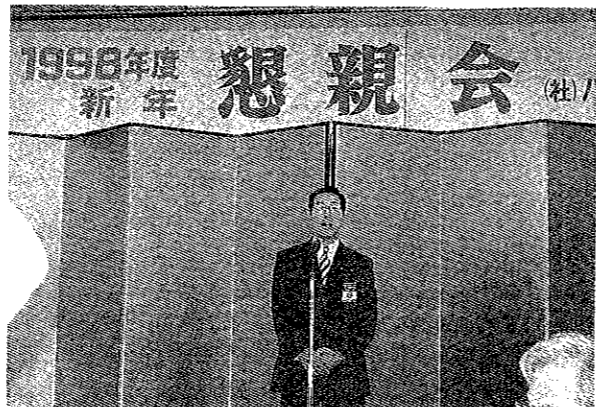
1月27日 新年総会懇親会