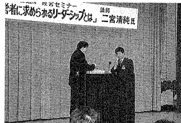
2月8日 「今経営者に求められるリーダーシップとは」

12月7日の年度末総会及び卒業式では、昭和34年生まれ8名の卒業生を送り出し1999年度最後の事業を無事終了した。