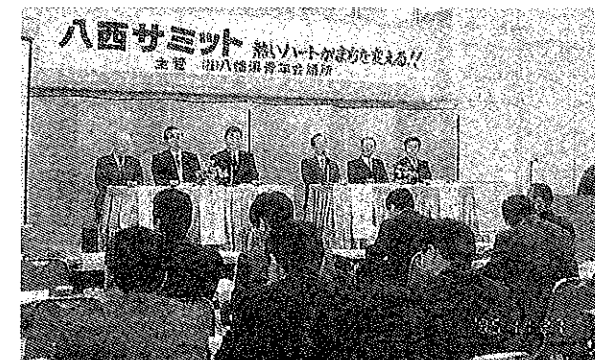
11月27日 1市5町の首長の参加を いただいた八西サミット