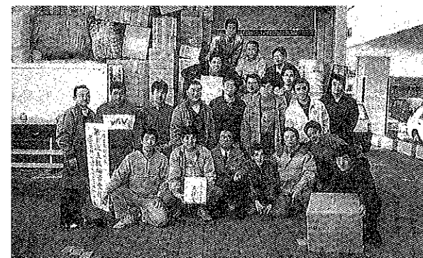
1月20日 多くの企業や会員の協力を得た 阪神大震災第1次支援物資

また、3月8日、会頭公式訪問例会で山本潤会頭は、震災によりご長男をなくされたこと、そして今後の決意を話され、参加者全員が感動を覚えるのであった。