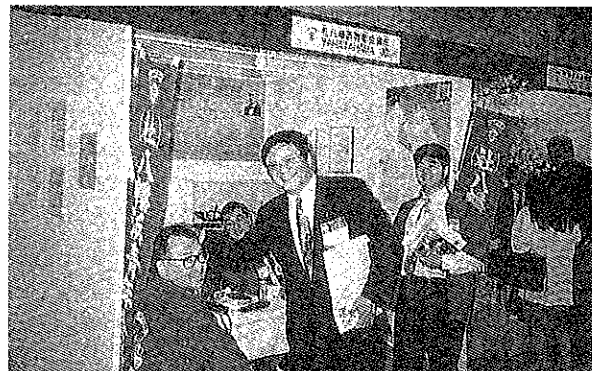
11月10日~20日 JCI世界会議神戸大会 八幡浜JCIロムブースにて