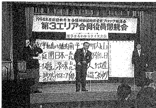
1月14日 第3エリア合同役員懇親会