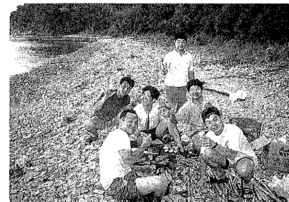
7月8日~9日 LD道場 (於黒島)