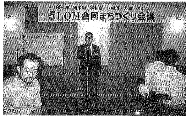
9月18日 5LOM合同まちづくり会議 宇和島にて