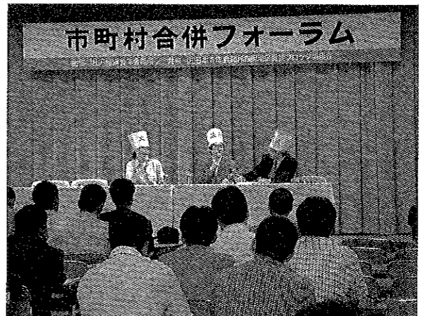
6月28日 市町村合併フォーラム