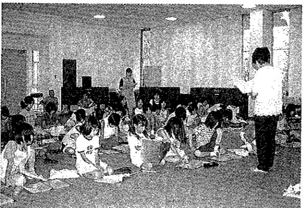
7月24～26日 八幡浜児童合唱団の夏期強化合宿