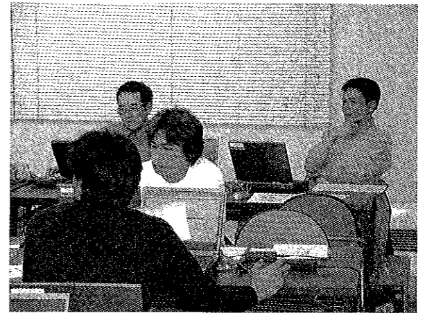
2月6・8・15・22日 パソコン勉強会