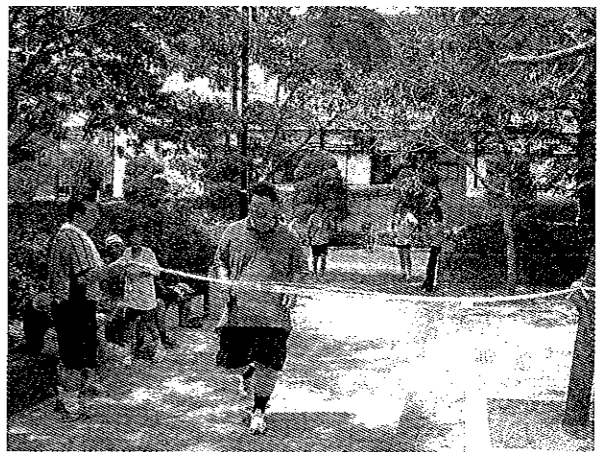
7月15日 ザ・トライアスロン リターンズ