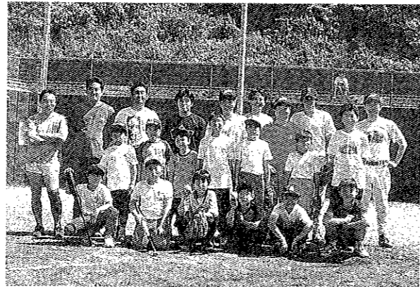
5月21日 ボーイズリーグ体験会