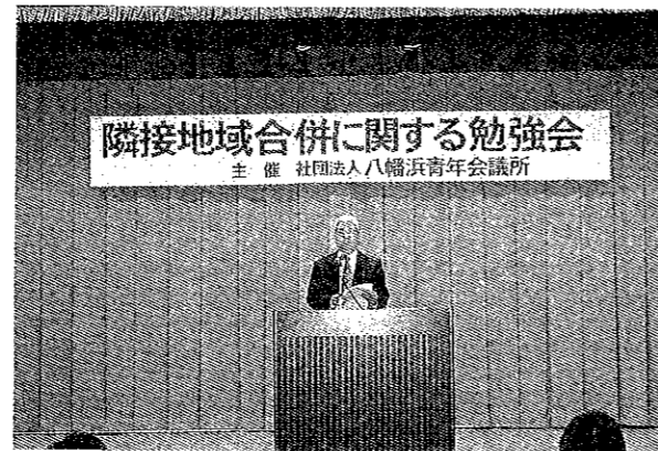
5月20日 合併問題についての勉強会

来年はいよいよ50周年を迎えます。大好きなJCに覚悟を決めて取り組んでいきましょう。 大城一郎」